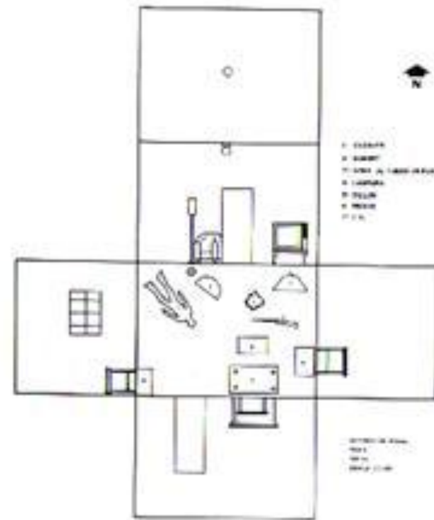
PLANO COM ABATIMIENTO (KENYERE).