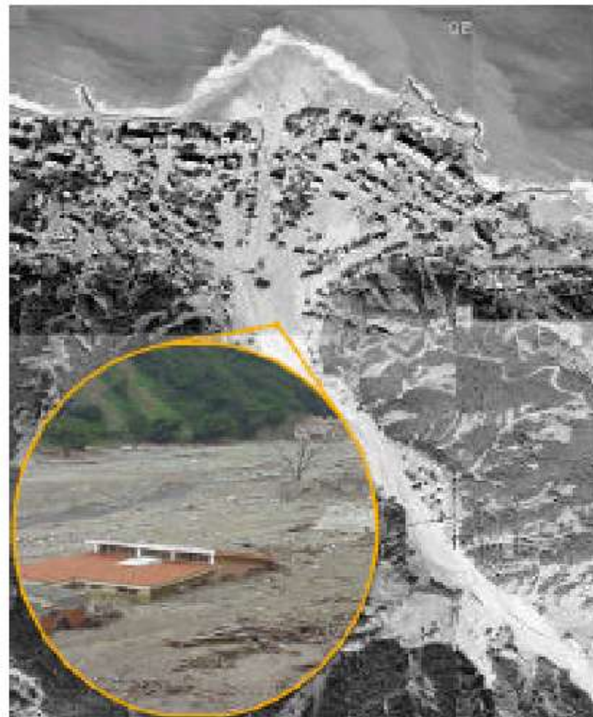
Vista del mismo sector (Tanaguarena) después del alud de 1999, que causó