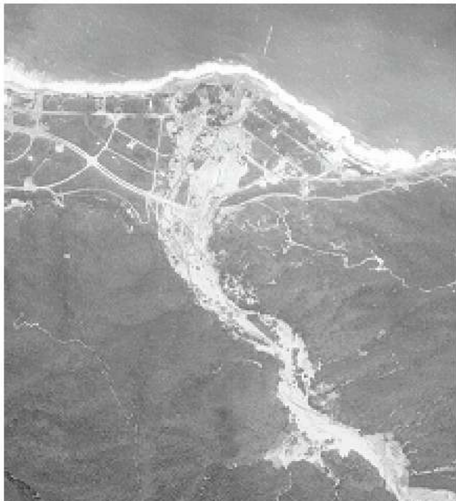
Vista área del sector Tanaguarena en el Estado Vargas después del alud torrencial de 1951. La construcción de las urbanizaciones estaba en su