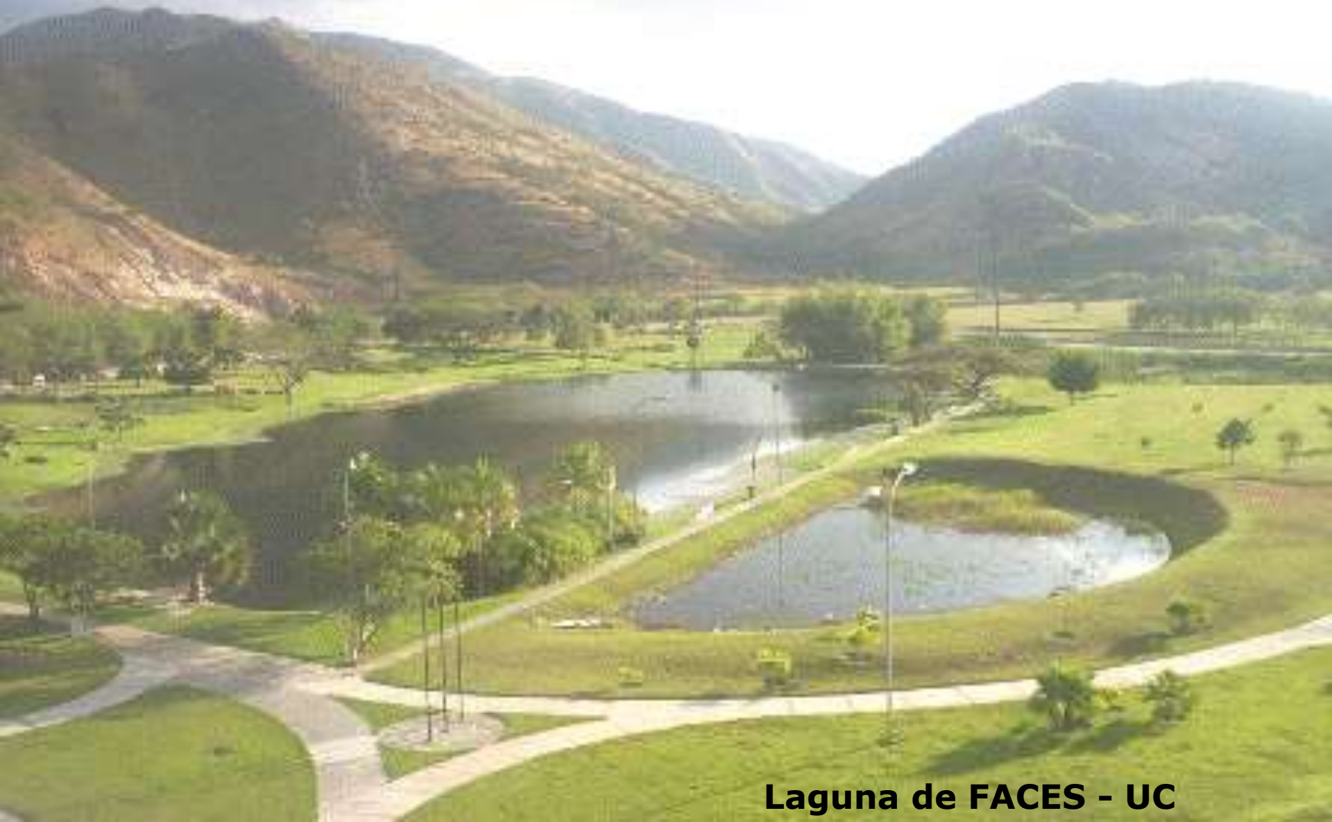
Laguna de FACES - UC